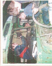
Практика на предприятиях города.